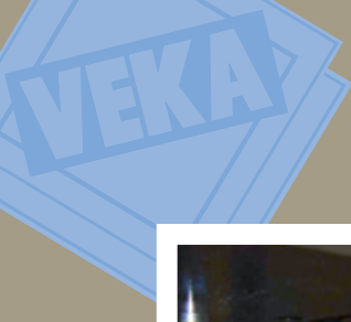
Control de calidad de los perfiles Veka